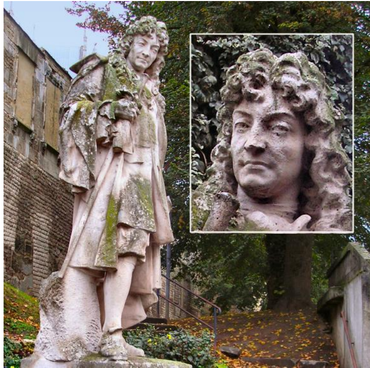
Statue érigée à Beauvais