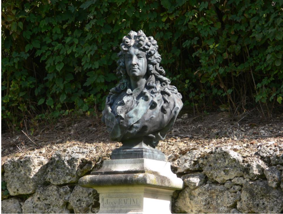
Statue érigée à Port Royal

Très tôt orphelin, Jean Racine est recueilli par son grand-père et éduqué aux Petites Écoles de Port-Royal, au sud de Paris, dans un établissement tenu par de pieux et austère jansénistes, les « Solitaires ».