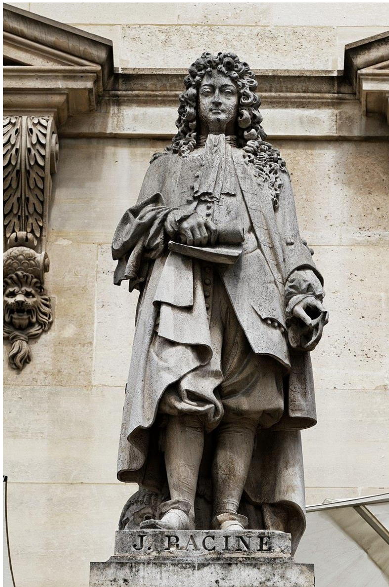
Jean RACINE au Louvre

Les infortunes des Œuvres de Jean Racine (Pierre Didot, 1801-1805) : réflexions sur la production et la réception d'un livre-monument