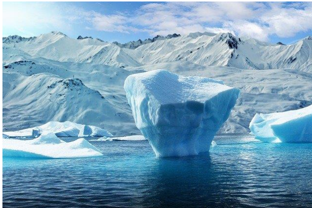
Journée mondiale du climat

11h20 12h20 semaine B : Club sciences animé par Mme Mangé & Mme Martin salle de sciences 14h30 : Visite d'une délégation Allemande de la ville d'Hassloch, jumelage Viroflay/Hassloch 15h20 - 17h15 : Intervention d'une Historienne, 3 classes de 4 ème 1, 4 ème 2, 4 ème 6. 15h20 – 16h15 : AS Badminton 16h20 – 17h15 : AS Badminton