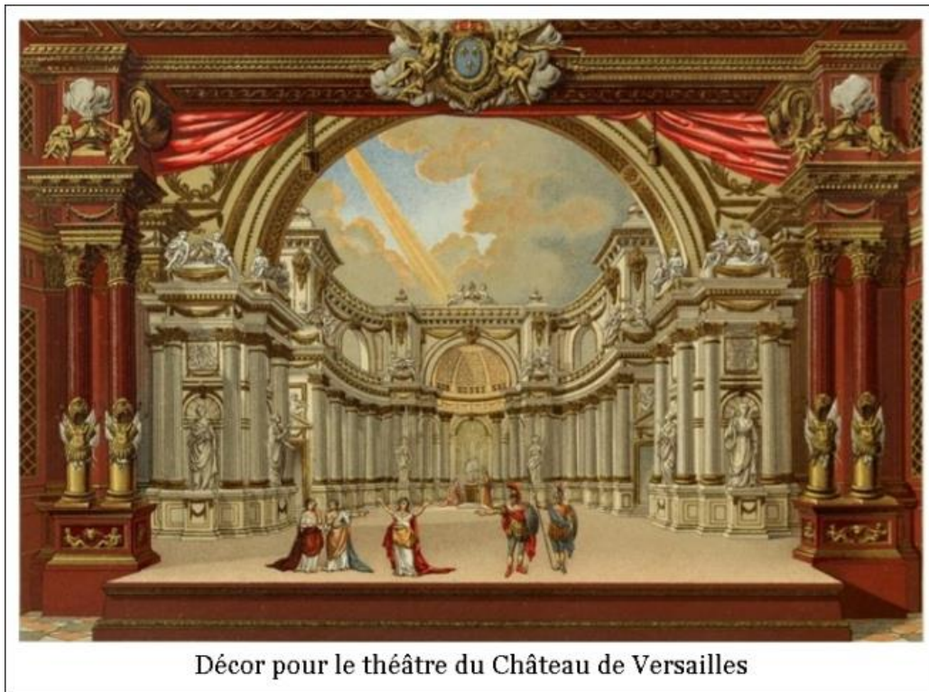
Décor pour le théâtre du Château de Versailles