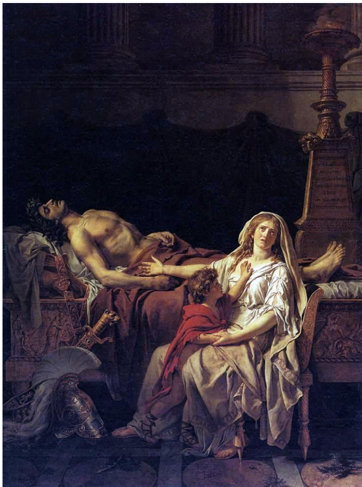
La Douleur et les Regrets d'Andromaque sur le corps d'Hector (1783) de Jacques-Louis DAVID