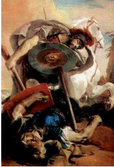
Étéocle et Polynice, par Tiepolo 1725

Dans la ville assiégée depuis six mois par les troupes de Polynice, Jocaste et Antigone espèrent ramener la paix et réconcilier les frères. Une rencontre est organisée, un cessez-le-feu instauré. Rien n'y fera et cette famille sera décimée par la haine.