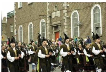
Parade à Dublin

En 1903, le parlement du Royaume-Uni consacre la fête de la St Patrick jour férié par le Bank Holiday Ireland Act. Elle est célébrée par une parade et diverses festivités dans plusieurs pays, dont l'Irlande (depuis 1931), mais aussi aux États-Unis, au Canada et en Australie. La première fête de la St Patrick n'a pas eu lieu en Irlande, mais à Boston aux États-Unis, en 1737, où de nombreux irlandais se sont installés au 17 ème et au 18 ème siècle.