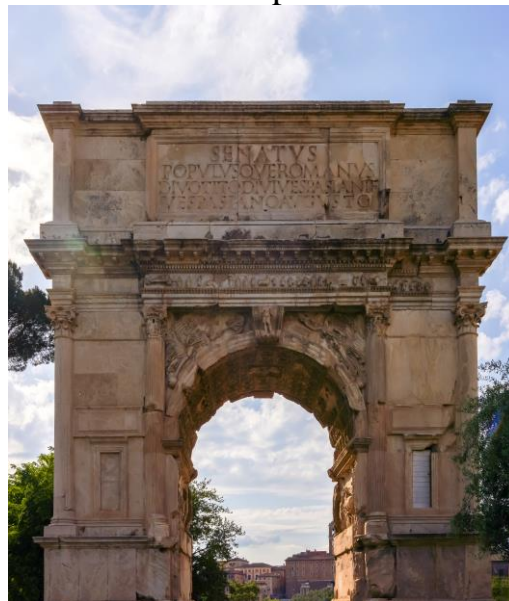
Arc de Triomphe de Titus

« Prince, après cet adieu, vous jugez bien vous-même Que je ne consens pas de quitter ce que j'aime, Pour aller loin de Rome écouter d'autres vœux. Vivez, et faites-vous un effort généreux. Sur Titus et sur moi réglez votre conduite. Je l'aime, je le fuis ; Titus m'aime, il me quitte.